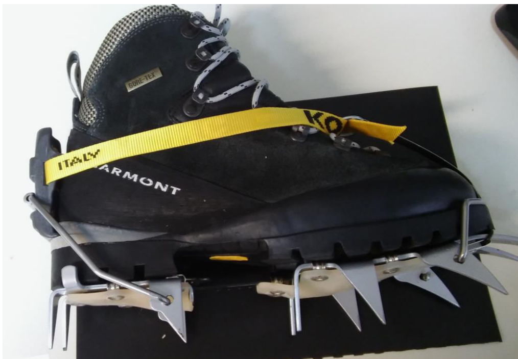
Το ορειβατικό άρβυλο και κραμπόν της ... Ελένης Πάνου.