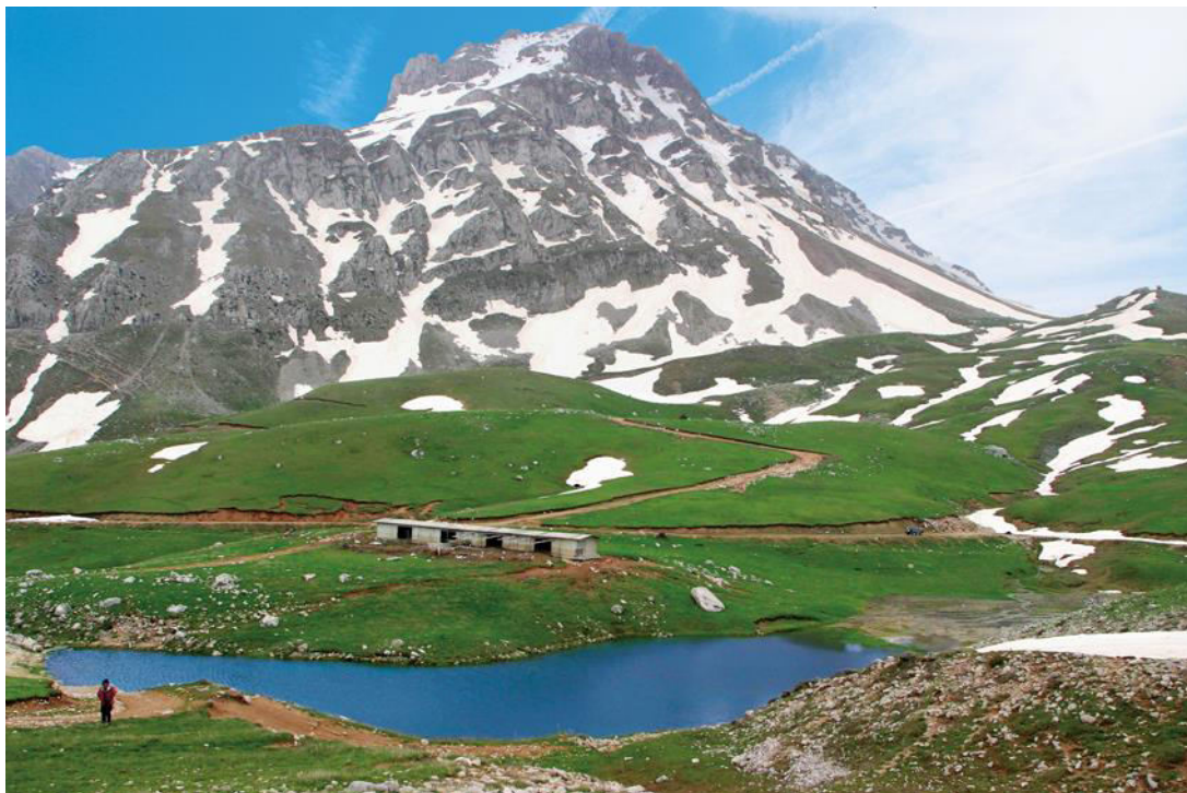
Ανοιξιάτικο τοπίο στα μουσουνισιώτικα λειβάδια των Βαρδουσιών.

Η ευχή «Πάντα ψηλά» που δίνουμε σε κάθε κορυφή που κατακτά ο ΦΟΣ γίνεται πραγματικότητα. Για πρώτη φορά θα ξεπεράσουμε το φράγμα των 1.750 μ., ανεβαίνοντας στα Βαρδούσια, που η ψηλότερη κορυφή του –ο Κόρακας- είναι 2.495 μ.