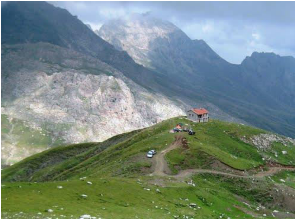
Ένα από τα καταφύγια (το ψηλότερο) των Βαρδουσίων.

Η εκδρομή είναι ΔΙΗΜΕΡΗ, ξεκινάμε από το Γεωπονικό Πανεπιστήμιο Αθηνών, στις 7:30 π.μ., το Σάββατο 10 Δεκεμβρίου 2016, φτάνουμε το απόγευμα στο χωριό Αθανάσιος Διάκος (Άνω Μουσουνίτσα), γενέτειρα του Αθανασίου Διάκου. Μετά από πορεία τεσσάρων (4) περίπου ωρών, φτάνουμε στο χαμηλότερο από τα δύο καταφύγια των Βαρδουσίων, στα 1.920 μ. όπου και θα διανυκτερεύσουμε. Το καταφύγιο είναι ανακαινισμένο, χωρητικότητας περίπου 70 ατόμων. Εκεί θα δειπνήσουμε (πλήρες γεύμα) και θα πάρουμε πρωινό την Κυριακή 11 Δεκεμβρίου προτού ξεκινήσουμε για τα ψηλώματα.