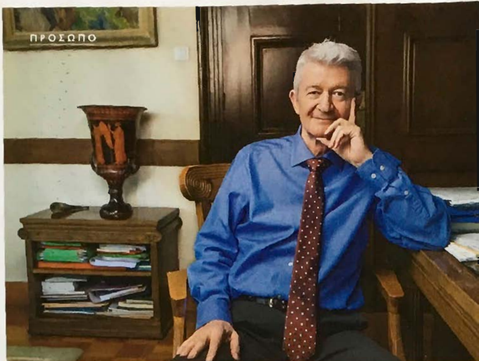
Στο γραφείο του, στον χώρο όπου βρίσκεται από το πρωί έως το βράδυ. «Αγαπώ το Γεωπονικό», λέει χωρίς ίχνος στόμφου, ως άνθρωπος που πέρασε εκεί το μεγαλύτερο κομμάτι της ζωής του.

της διάρκειας και της προσφοράς που δίνει όταν μιλάει για το πανεπιστήμιο.