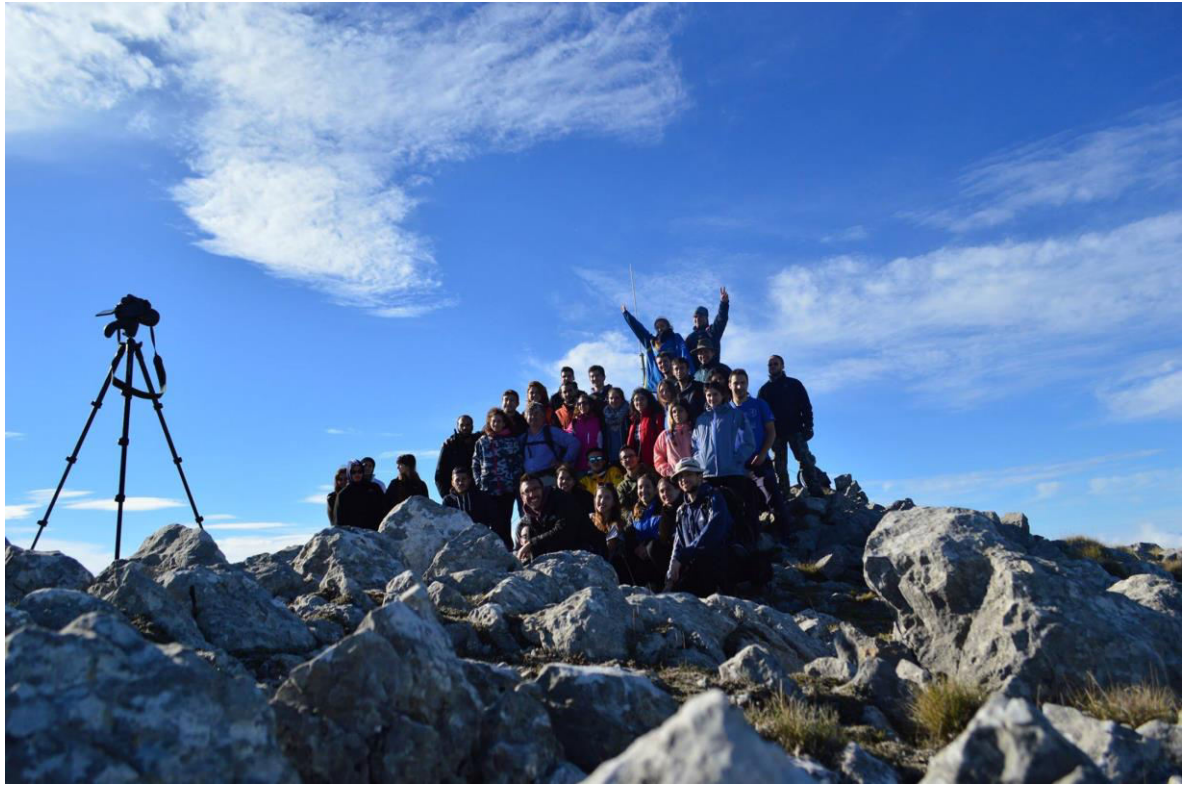
Η θέα στον Κορινθιακό κόλπο από την κορυφή!