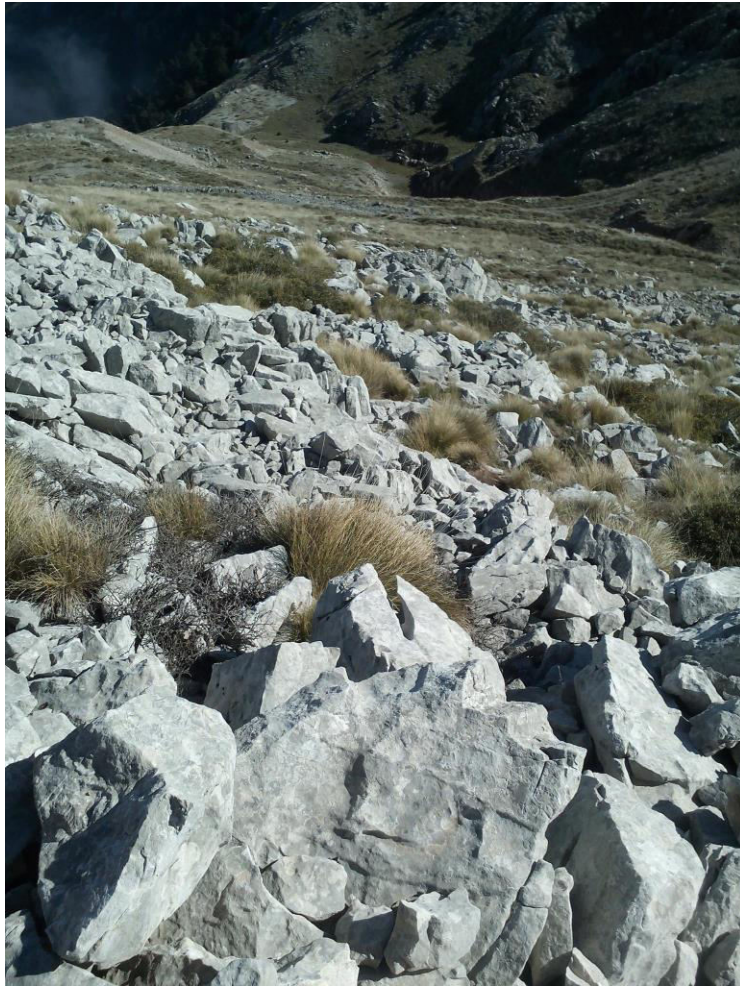
Το βραχώδες τοπίο χαρακτηρίζει την Παλιοβούνα.