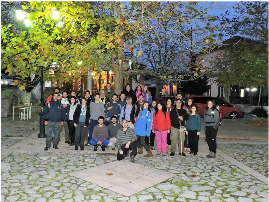
Η επιστροφή το βράδυ στο χωριό Αγία Άννα.