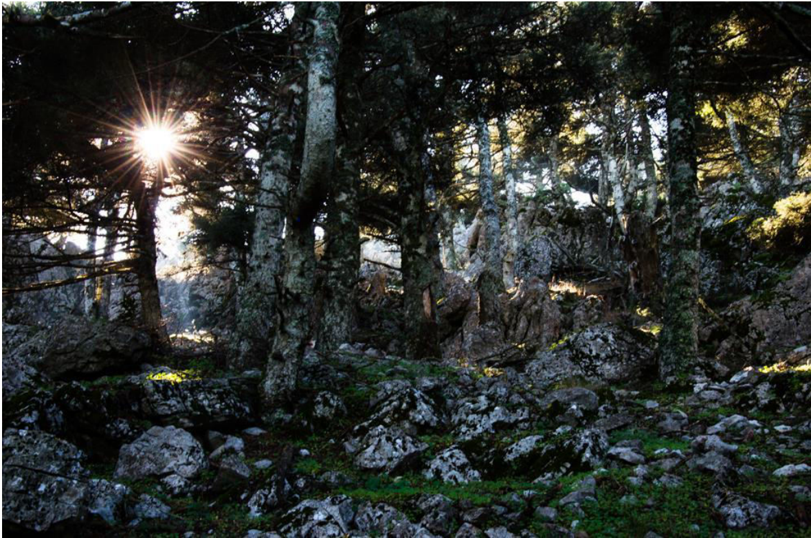
Μέσα στο ελατόδασος.