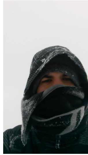
Κρύο ... πολύ κρύο!