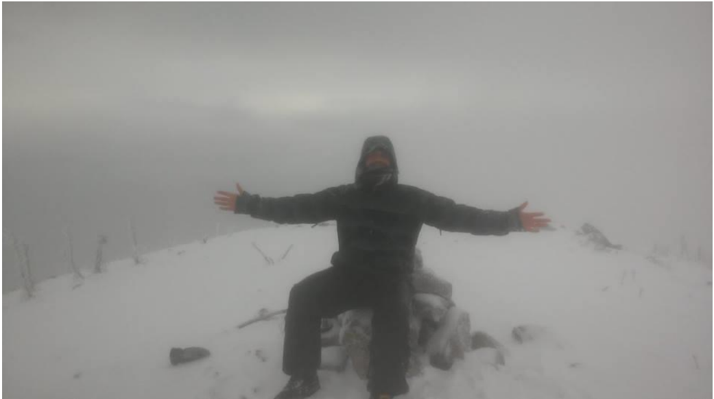
Η κατάκτηση της κορυφής!