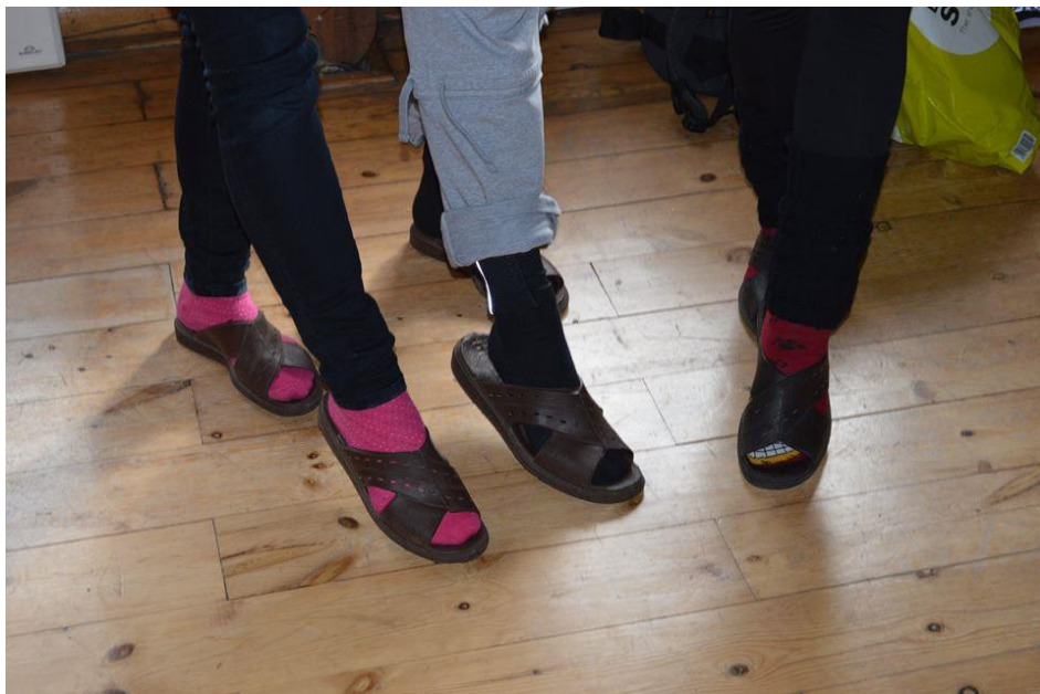
Στιγμές στο καταφύγιο.