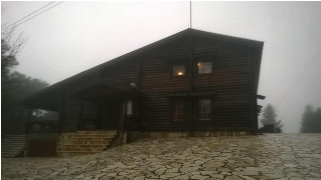
Το καταφύγιο στο όρος Κυρά-Βγένα