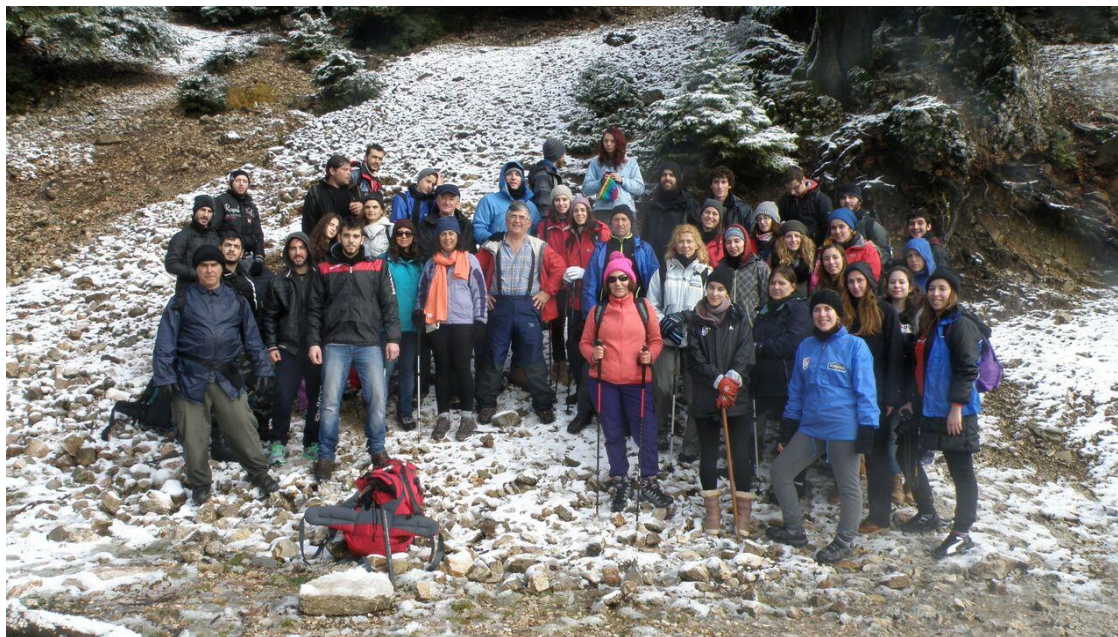
Όλη η ομάδα κοντά στην πρώτη πηγή.