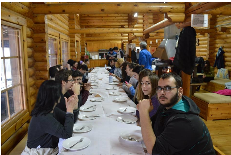
Στιγμιότυπα στο καταφύγιο που δείχνουν τη συντροφικότητα και το δέσιμο που αναπτύσσεται μεταξύ των μελών του Φ.Ο.Σ. του Γ.Π.Α.