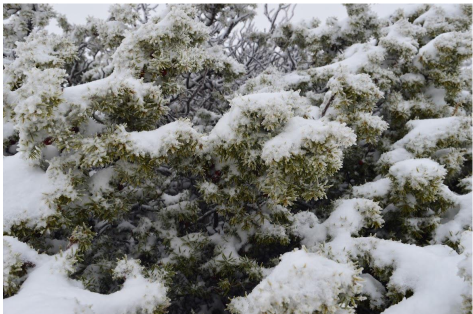
Χιονισμένα τοπία στην Κυρά-Βγένα.