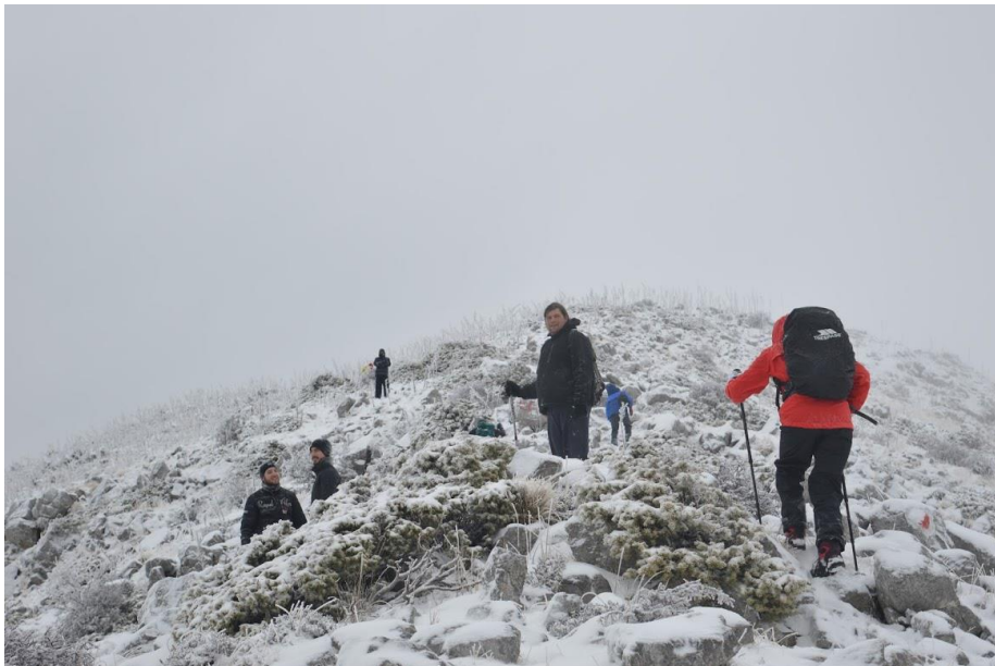
Η χιονισμένη κορυφή Κόκα ξεπροβάλλει από την ομίχλη.