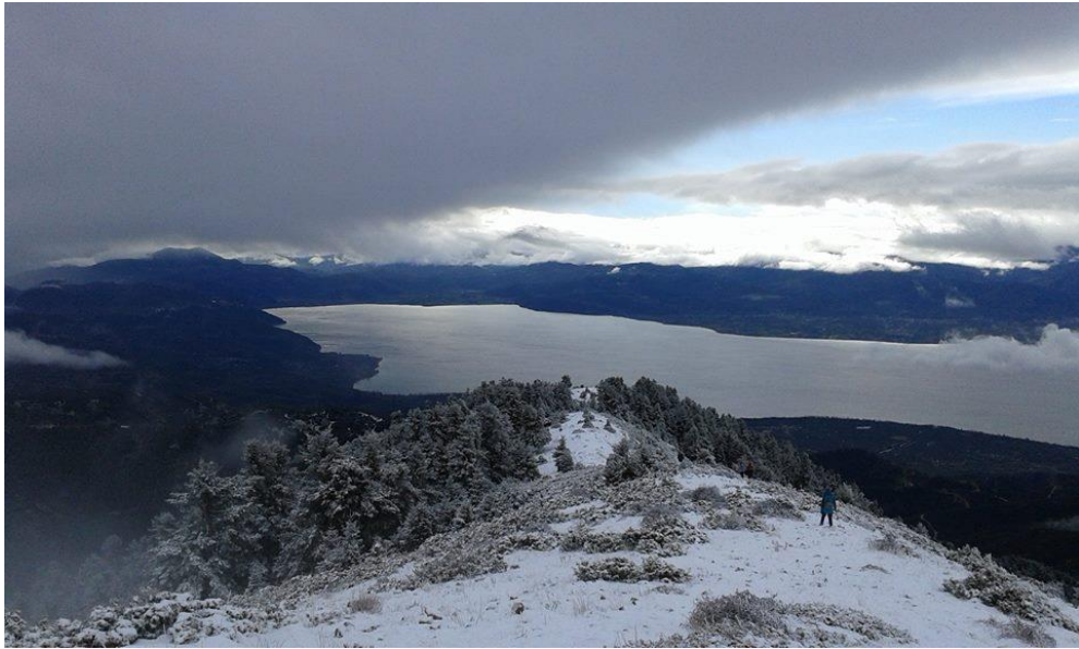
Η Τριγωνίδα λαμποκοπά κάτω χαμηλά.