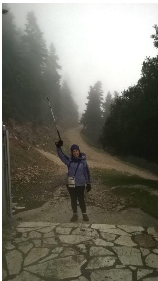
Η Αντιπρότανης Αν. Καθηγήτρια Μ. Καψοκεφάλου φτάνει θριαμβευτικά στο καταφύγιο.