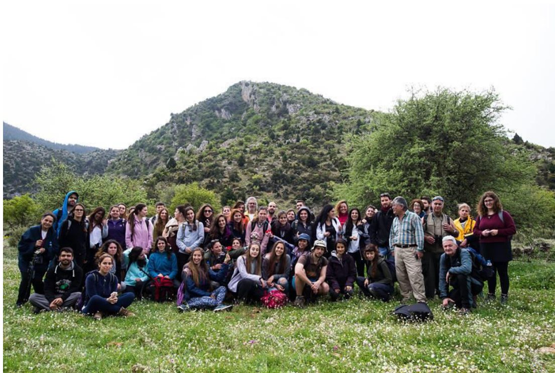
Ο Φ.Ο.Σ. στο Ξηροκάμπι. Στο βάθος η απότομη πλευρά του λόφου του κάστρου της Ωριάς