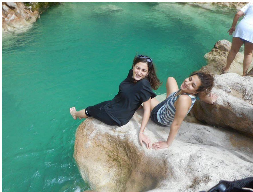
Απολαμβάνοντας την κρυμμένη ομορφιά του φαραγγιού