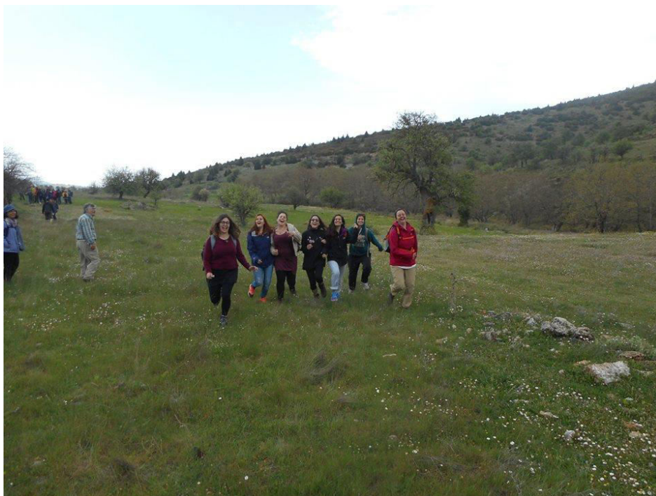
Ξηροκάμπι. Προς το κάστρο της Ωριάς