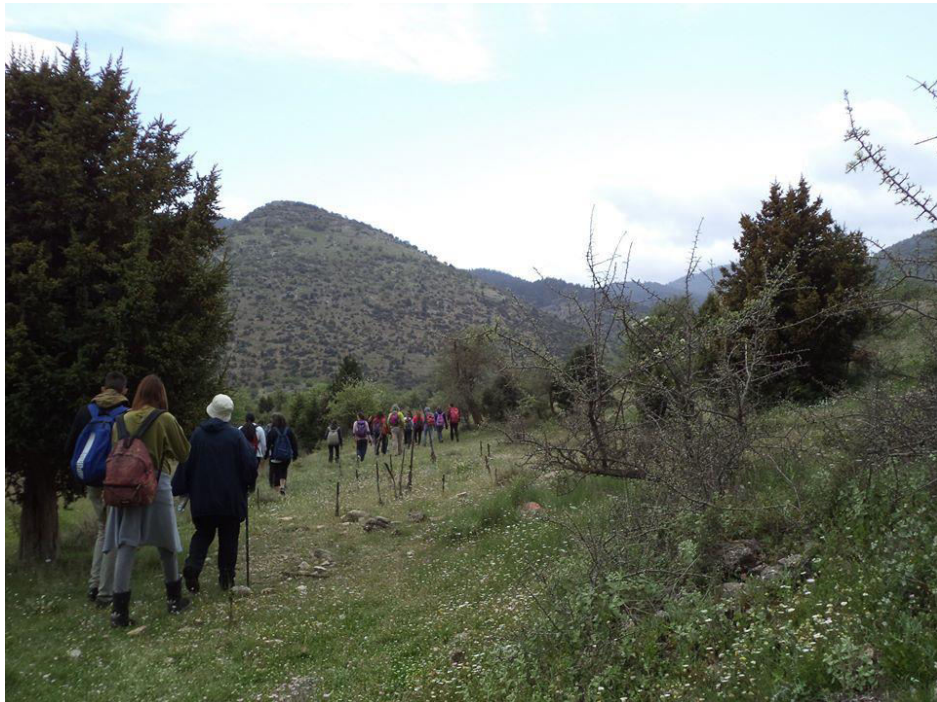
Ξηροκάμπι. Προς το κάστρο της Ωριάς. Διακρίνεται το ενδημικό είδος κέδρου Juniperus drupacea