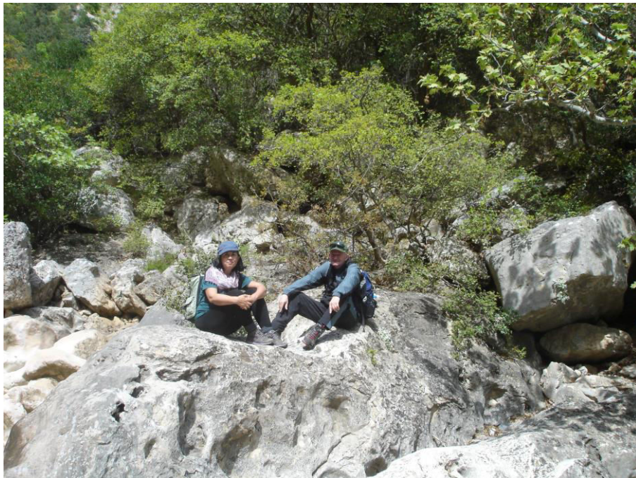
Ο Πρόεδρος και η Αντιπρόεδρος του Γ.Π.Α. μακριά από την ένταση της μέριμνας του Πανεπιστημίου