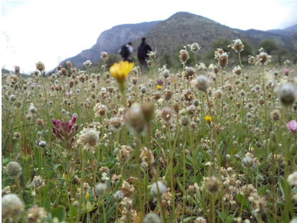
Ολάνθιστο το Ξηροκάμπι προς το κάστρο της Ωριάς