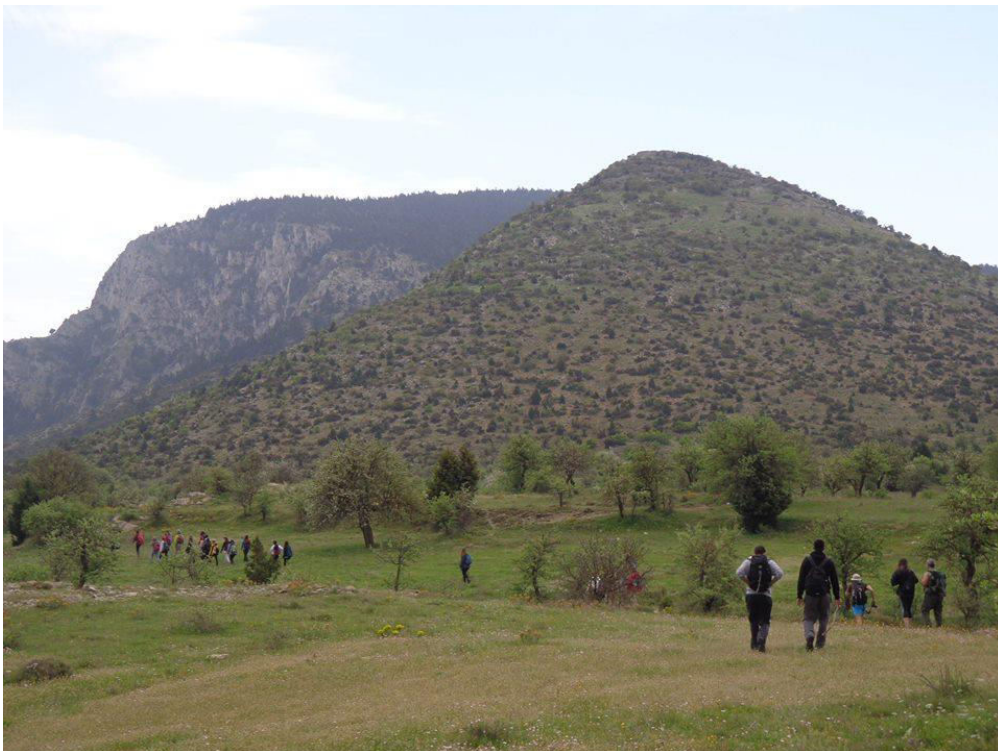
Ξηροκάμπι. Προς το κάστρο της Ωριάς