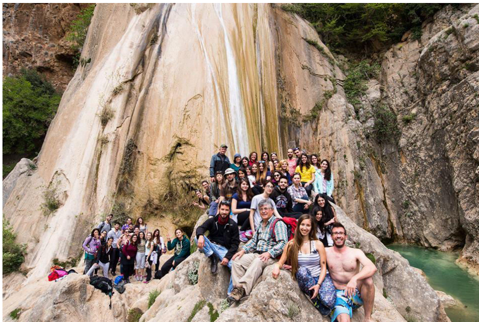
Η ομάδα του Φ.Ο.Σ. Γ.Π.Α. στον καταρράκτη του φαραγγιού της Ζαρμπάνιτσας (Βρασιάτη)