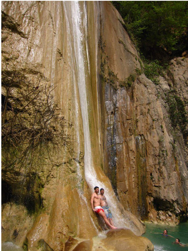
Απόλαυση δροσιάς στη βάση του καταρράκτη του Βρασιάτη