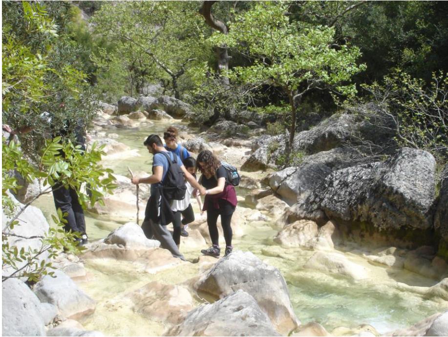
Εμπρακτη η συνεργασία και η αλληλοβοήθεια στον Φ.Ο.Σ. Γ.Π.Α.