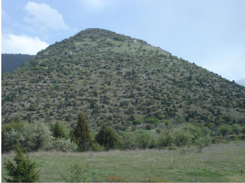
Ο λόφος με το κάστρο της Ωριάς στην κορυφή